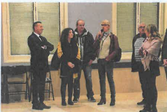
Les membres d' INITIATIVES 77